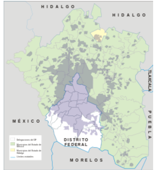
Mapa del área metropolitana de la ciudad de México.

Existe una crítica a las estimaciones de estos núcleos, dada su excesiva superficie y a la inclusión de grandes zonas vacías. [cita requerida] También suscita crítica la gobernabilidad de las megalópolis con asentamientos en varios estados o provincias, lo que provoca que sus dimensiones sean difícilmente cuantificables, al no existir una administración centralizada. [cita requerida] En el proceso de urbanización básicamente al unirse dos o más metrópolis se forma una gran conurbación o megalópolis que es un concepto diferente de ciudad con nuevas soluciones y nuevos problemas.