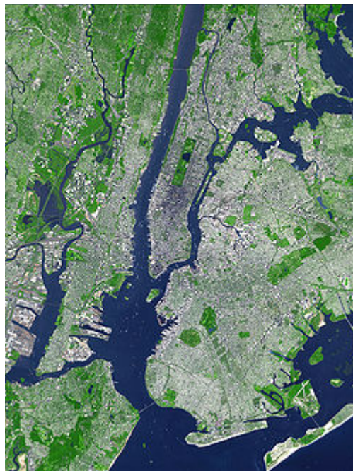
Imagen satelital del área metropolitana de Nueva York.

El autor tiende a presentar a tal Megalópolis estadounidense como una nueva Roma: " fait un peu figure à l'époque présente de ce que fut la Rome impériale du monde antique. L'Atlantique semble être la Mare Nostrum de cette nouvelle Mégalopolis aux dimensions extraordinaires (Hecha un poco a figura en la presente época de aquello que fue la Roma imperial del mundo antiguo. El Atlántico parece ser el Mare Nostrum de esta nueva Megalópolis de dimensiones extraordinarias)." 4 Esta comparación anticipa el análisis que desemboca para tres centros de desarrollo urbano presentados en 1975 en la Triada de Ken'ichi Ōmae . Otras megalópolis fueron seguidamente identificadas y analizadas por otros estudiosos en los años 1960s y 1970s Doxiadis estudió la megalópolis de los Grandes Lagos , Peter Hall la megalópolis inglesa, Isomura la megalópolis japonesa del Tokaido, otros estudiosos italianos como Muscara la posible "megalópolis" mediterránea .