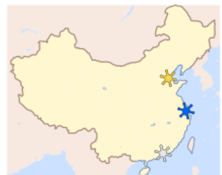
Megalópolis en China: deltas de los ríos Amarillo, Yangtsé y Perla