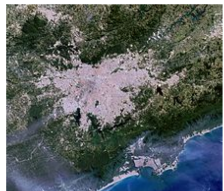
Vista satelital São Paulo.