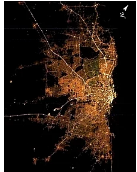
Vista nocturna del Gran Buenos Aires, Argentina.

Singapur en el pequeño estado independiente del mismo nombre y ciudades de Malasia como Kuala Lumpur tienden a constituir una megalópolis.