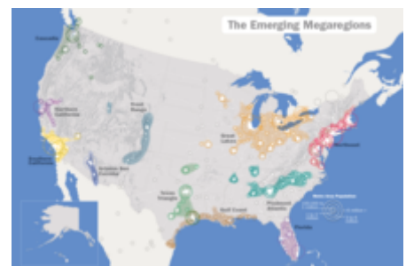
Megalópolis en Estados Unidos.