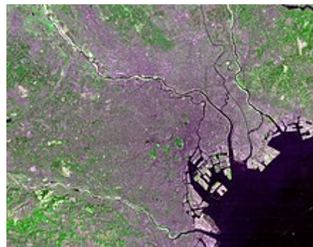
Imagen de satélite de Tokio.