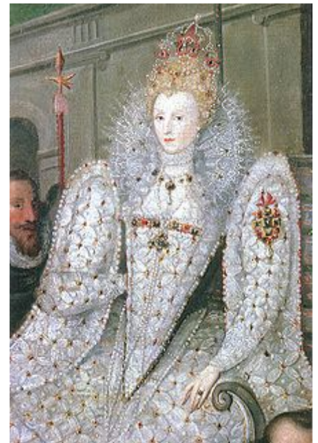
Elizabeth I. Procession portrait (detail)

En la época victoriana el maquillaje se encuentra atravesando la revolución industrial , éste ha llegado al pueblo y la realeza deja de utilizarlo, ya que este uso se empieza asociar con prostitutas o el gremio de artistas que se dedica a la caracterización de personajes que por lo general era circense. Entonces se veían rostros naturales, cuidados del sol para no cambiar de tono cubiertos con polvo de arroz y si éste cambiaba utilizaban zumo de limón como blanqueador para despigmentar, las cejas eran delgadas y depiladas si fuese lo contrario, para agregar color a las mejillas muchas las pellizcaban o frotaban un poco de remolacha en ellas